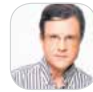
ΕΠΙΜΕΛΕΙΑ ΓΙΩΡΓΟΣ ΑΥΤΙΑΣ

στρατηγική στην εθνική γραμμή της χώρας και να μην ανεχτεί από κανέναν συνειδητά ή ασυνειδητά, εν προκειμένω ασυνειδητά, να διαταράξει την ομαλή πορεία της χώρας προς την οριστική έξοδο από την κρίση και τα μνημόνια. Αυτά από πλευράς κυβέρνησης, που πάει χέρι-χέρι με τον κ. Καμμένο, ο οποίος επιβιβιώνεται όταν έλεγε ότι «θα πάμε μαζί έως το τέλος». Επόμενο ήταν οι εξελίξεις να προκαλέσουν μπαράζ αντιδράσεων, με τον κ. Μητσοτάκη να δηλώνει «ότι τελειώνει ο θίασος» και την κα Γεννηματά ότι «το πουλόβερ ξηλώνεται...».